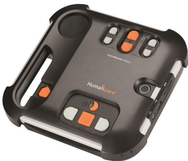
Victor Stratus 12 med överlägg monterat

Vid leverans följer, förutom själva spelaren, eventuellt tangentbordsöverlägget och denna instruktion, följande med: